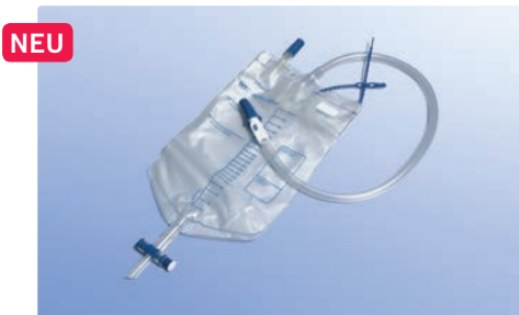
NEU ist der inklusive Thorax-Drainage-Sekretauffangbeutel mit integriertem Heimlichventil zum Anschluss an die Thorax-Katheter.